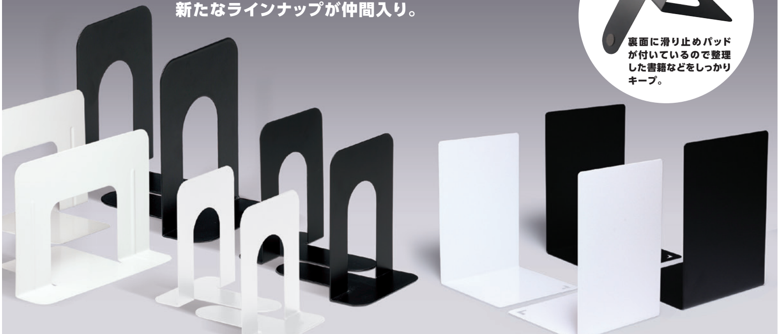
単品サイズ比較図